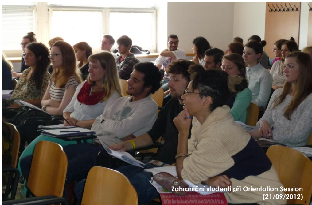
Zahraníční studenti při Orientation Session (21/09/2012)