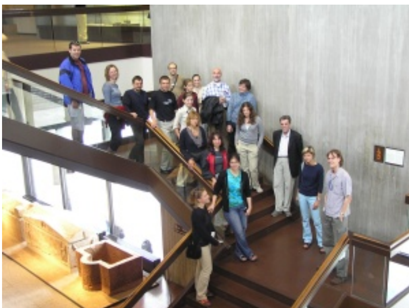
Fotogalerie z fakultní poznávací cesty do Itálie z roku 2013 a 2014 a také z cesty do Francie z roku 2015 a 2016 .