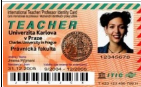
Průkaz zaměstnance UK s licenci ITIC