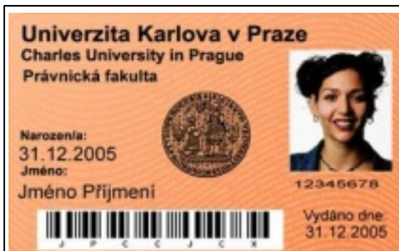
Průkaz zaměstnance UK