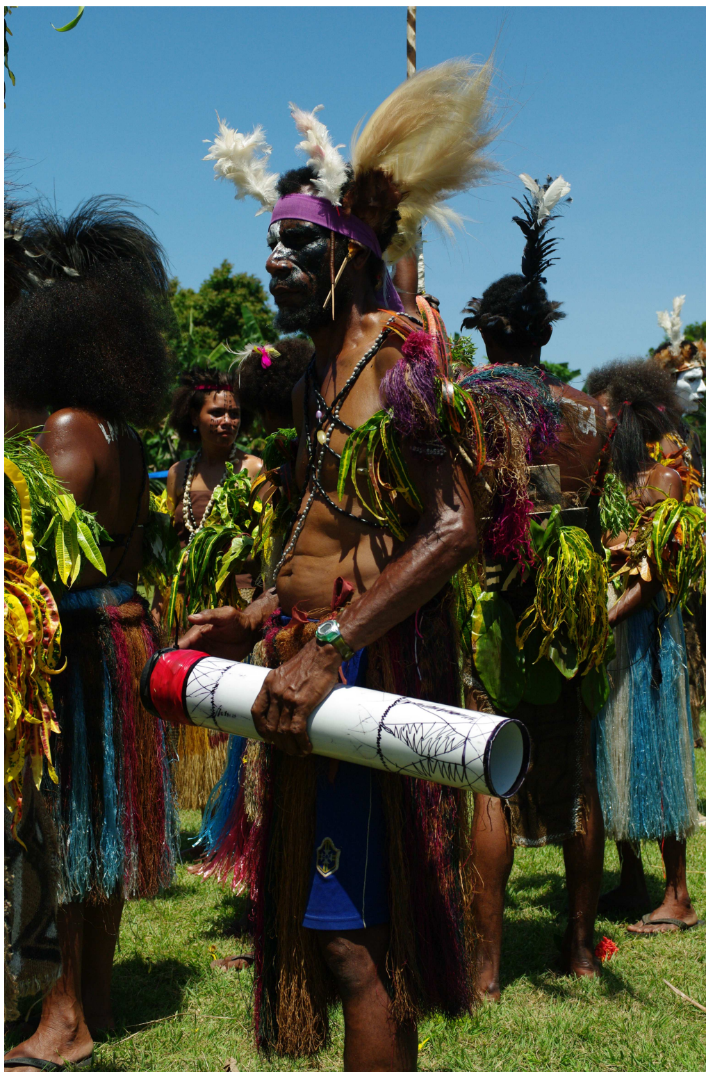
Obrázek 1. Kulturní Show v Madangu, srpen 2009. Buben kundu z umělé hmoty.